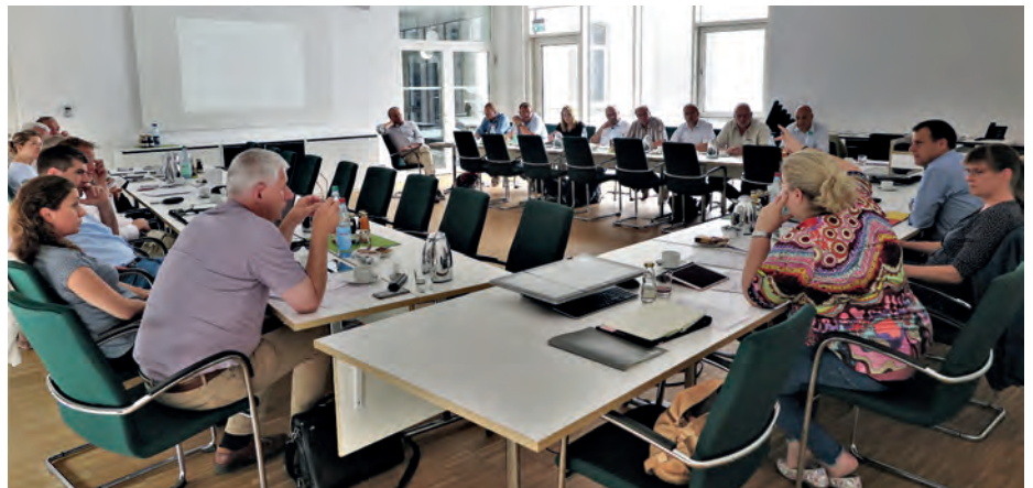
Teilnehmer und Gäste der gemeinsamen Gremiensitzung der Fachkommission Qualitätssicherung und Handelsfragen sowie des Ausschusses Handel, Qualität und Ökologie.

Ergänzend wurden aktuelle Entwicklungen im Bereich Wirkstoffe und Pflanzenschutzmittel erörtert, insbesondere die Situation bei den Mitteln zur Wahrung der Keimruhe. Noch in der Sitzung erreichte die Teilnehmer die Nachricht der Europäischen Kommission zur Nichterneuerung der Genehmigung für den Wirkstoff Chlorpropham (CIPC). Die Entscheidung der EU-Kommission stützt sich auf die Schlussfolgerungen der EFSA zu diesem Wirkstoffstoff. Bis spätestens 8. Januar 2020 müssen die Mitgliedstaaten die Zulassungen für Pflanzenschutzmittel, die Chlorpropham als Wirkstoff enthalten, widerrufen. Zudem müssen die von den Mitgliedstaaten eingeräumten Aufbrauchfristen so kurz wie möglich sein und spätestens am 8. Oktober 2020 enden. Derzeit argumentiert die europäische Kartoffelwirtschaft für einen Antrag auf Erlangung eines vorübergehenden Rückstandshöchstgehalts für Chlopropham. Dieser ist erforderlich, da CIPC auch nach intensiver Reinigung