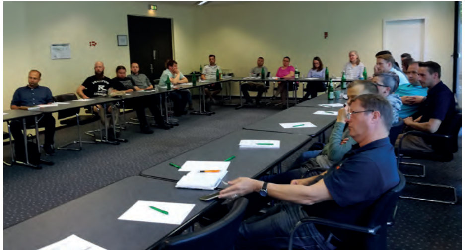
Die Teilnehmer der Ausbildung Fachkraft Kartoffel diskutieren aktuelle Fragen.

Wie viele andere Branchen auch, wirbt die Kartoffelwirtschaft um qualifizierten Nachwuchs und Fachkräfte. Mit einer branchenspezifischen Aus- und Weiterbildung, die der Deutsche Kartoffelhandelsverband e.V. organisiert und anbietet, erhalten insbesondere Neu- und Quereinsteiger auf die Belange und Anforderungen der Kartoffelwirtschaft ausgerichtetes Wissen vermittelt. In einem insgesamt 4-tägigen Kurs werden die Themen Warenkunde, Züchtung, Acker- und Pflanzenbau, Ernte und Kartoffellagerung, Kartoffelgesundheit, Qualitätssicherung und -management sowie gesetzliche Regelungen – gekoppelt mit praktischen Übungen – vermittelt. Erfahrene Lehrsachverständige und Dozenten leiten die Ausbildung.