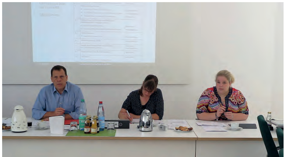
UNIKA- und DKHV-Gremiensitzung in Hannover.