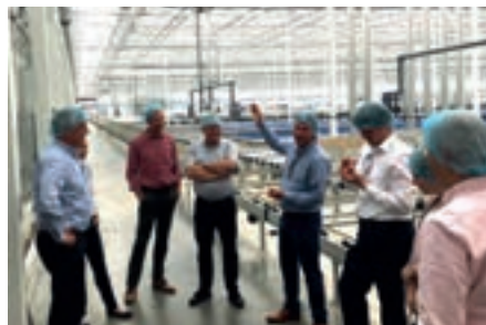
Mitglieder des QS-Fachbeirats Obst, Gemüse, Kartoffeln beim Unternehmensbesuch von Koppert Cress BV, Niederlande.