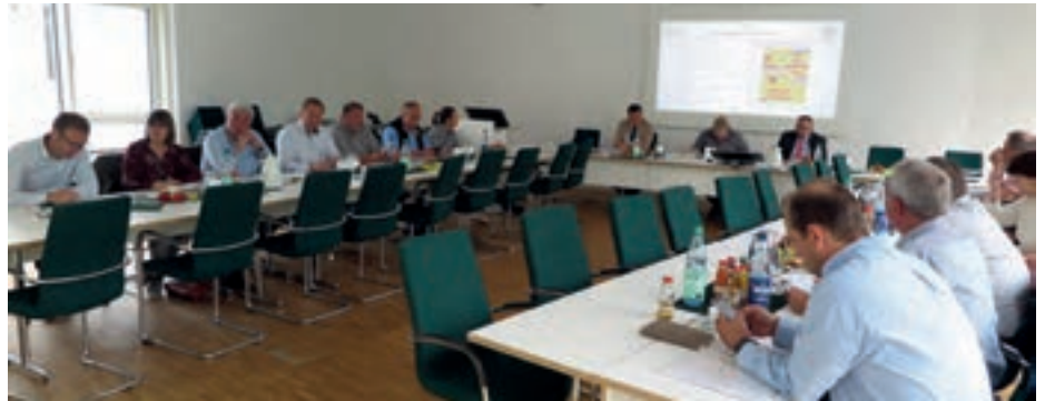
Teilnehmer der gemeinsamen UNIKA/DKHV-Gremiensitzung am 07.06.2017 in Hannover.

Von den Experten ausgewertet wurde zudem die am 31. Mai in Berlin stattgefundenen IFS-Konferenz Obst und Gemüse, welche den „IFS wholesale/Cash&Carry 2“ als einen Schwerpunkt hatte. Dieser IFS-Standard ist besonders